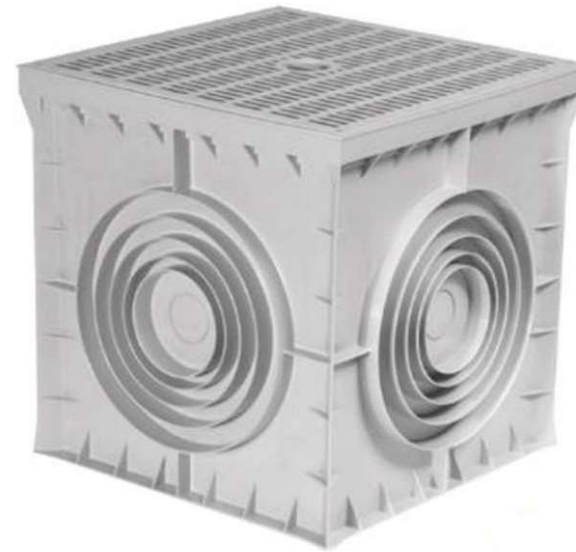
Sumideros PVC con rejilla.