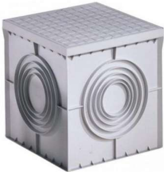
Sumideros PVC con tapa.

Sumideros PVC para piso, ideal para desagüe de líquidos en estacionamientos, piscinas, jardines, áreas de servicio, centros comerciales, bajadas de aguas lluvias en edificios, hospitales, gimnasios, laboratorios, zonas de carga, evacuación de aguas lluvias en general.